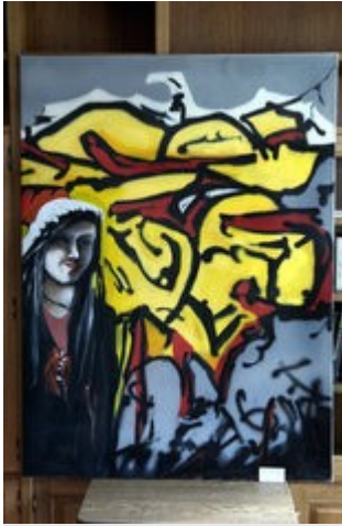
Junge Kunst aus der Werkstatt von Ausstellungsinitiator Wolfgang Huss.

Auf einem Foto von Ingrid Schrik ist ein junges Pärchen verewigt, sie mit einer roten Strähne und er mit Piercing und abstehenden Haaren. Sie schauen mehr selbstbewusst als skeptisch in die Kamera, genauso wie der Jugendliche vor dem Graffiti, den Wolfgang Huss in Öl gebannt hat.